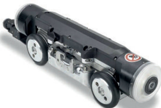
Panorama 'still techniek'